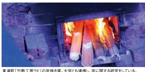
東浦町「竹酢工房ワド」の炭焼き窯。大学とも連携し、炭に関する研究をしている。

例えば、雪が多く降る北海道の住まいには、屋根への積雪を防ぐための工夫が欠かせません。台風が多い沖縄の住まいは、どんな強風にも動じないコンクリート造りが主流です。快適な暮らしを実現するためには、その土地の風土に合った住まいづくりが大切だということなのです。そこで、タツミホームは考えました。