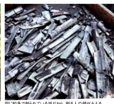
同じ知多で創られている炭だから、創る人の顔がみえる。

例えば、雪が多く降る北海道の住まいには、屋根への積雪を防ぐための工夫が欠かせません。台風が多い沖縄の住まいは、どんな強風にも動じないコンクリート造りが主流です。快適な暮らしを実現するためには、その土地の風土に合った住まいづくりが大切だということなのです。そこで、タツミホームは考えました。