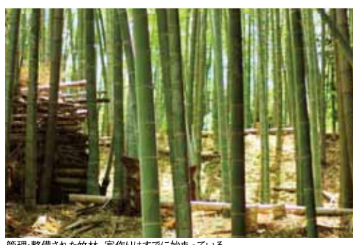
管理・整備された竹林。家作りはすでに始まっている。

そして完成したのが、一軒あたり竹炭500kgを含有、地産地消の「炭の家」。炭の持つ吸着性や脱臭性を活かして、調湿や空気の浄化効果に優れた、ロングライフの健康住宅です。もちろん使用する炭は、知多の竹林で伐採して炭化した竹炭100%。地元の炭焼き職人たちが丹精込めて作っています。健康に暮らす人の住まいには、自然の風土と上手く付き合う工夫があります。